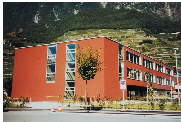
Centro scolastico di Fully, Vallese

Gli scambi termici con l'edificio sono minimi e la ricarica termica del terreno è assicurata dall'evacuazione di cariche interne nella stagione calda, ciò permette di rinfrescare l'edificio tramite una rete integrata di solette. Associato ad un sistema di riscaldamento a bassa temperatura, questo dispositivo fornisce rendimenti elevati alla pompa di calore.