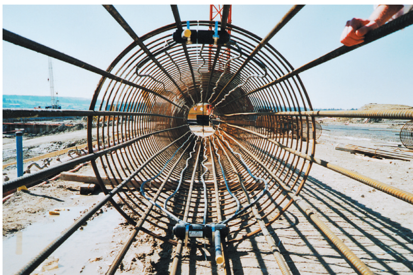
Dettaglio dell'armatura di un palo energetico sul cantiere del futuro Dock Midfield, aeroporto di Zurigo

Il funzionamento dell'installazione si svolge in un ciclo annuale, con un'estrazione del calore dal terreno durante la stagione di riscaldamento (iniezione di freddo) ed un'estrazione di